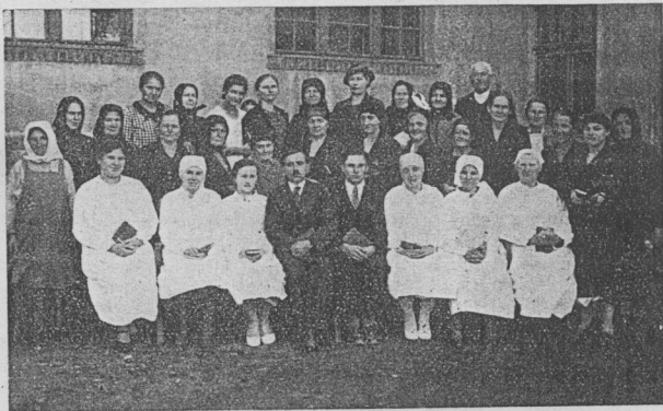
SZOLNOK, SZEPTEMBER 13.

Látjuk, hogy Isten előtt bárki is csak alázatosság által lehet kedves. Az Ige felvilágosít minket arról, hogy orcája előtt megállni nem lehet alázatosság nélkül, sőt annyira fontos előtte az alázatos-